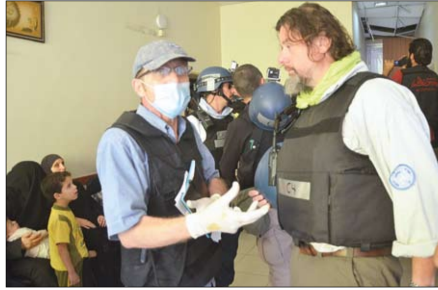
المفتشون الدوليون يعاينون الصابين بالهجوم الكيماوي في المستشفيات