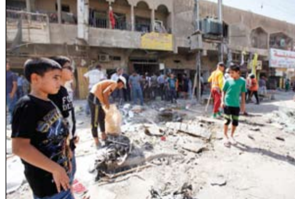
عراقيون يعاينون موقع انفجار قنبلة في بغداد