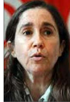
ميه الجريب على رأس قائمة الاغتيالات