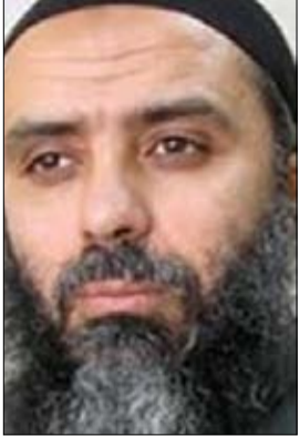
ابو عياض زعيم انصار الشريعة