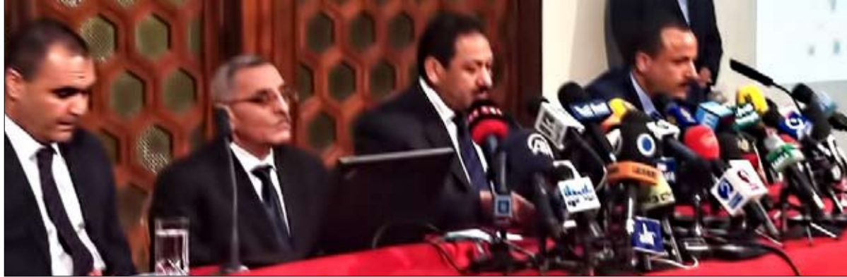
التدويرة الصحفية لوزارة الداخلية التونسية