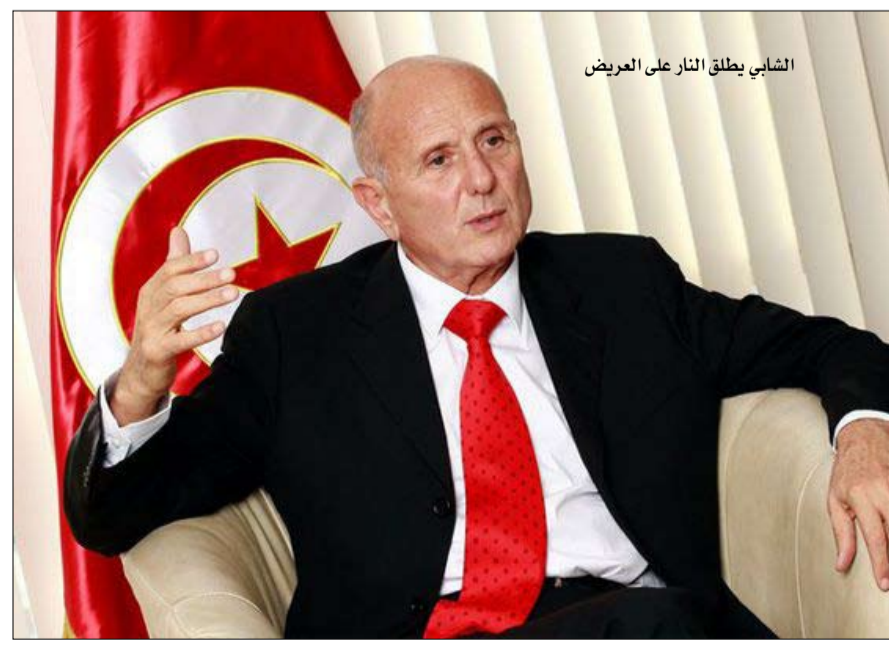
الشابي يطلق النار على العريض

وأضافت الجريبي أن العريض يتجاهل الواقع وليس